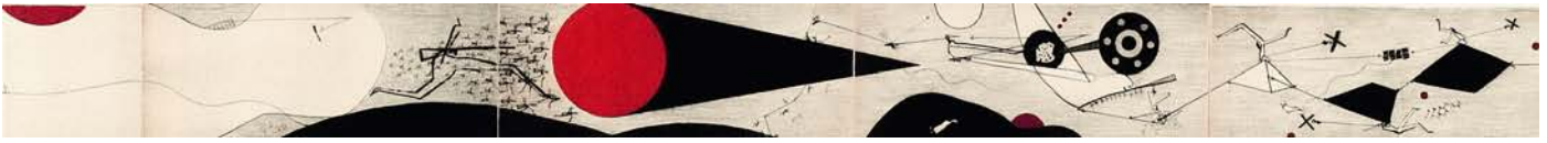
Marsschatten 2009 (Ausschnitt) Leporello, Kaltnadel 12 x 304 cm