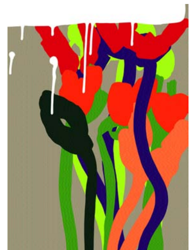
Dripping I/2010 Dripping II/2010 Dripping III/2010 Serigrafien Bild: 70 x 50 cm Blatt: 88 x 66 cm