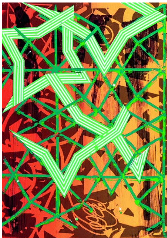
<mural>, 2009 Serigrafie Bild/Blatt: 100 x 70 cm