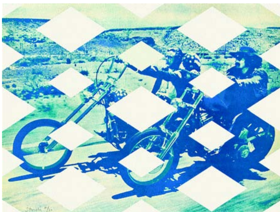
<Crystal Dreams> III/09