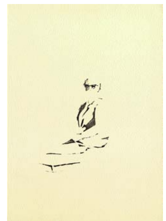
„Aus dem Leben von Frau A“ 1-3/2010