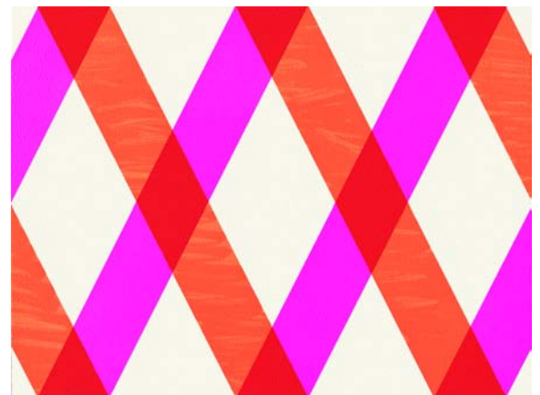
<Crystal Dreams> IV/09