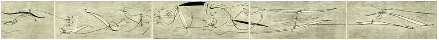
The great Flood, 2008 (Ausschnitt) Leporello, Kaltnadel 9,5 x 184 cm