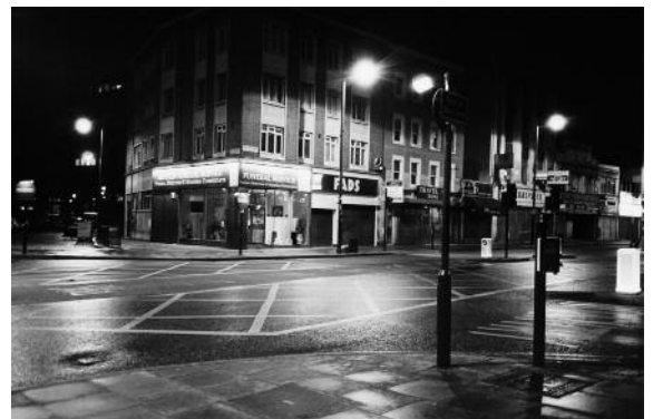
Brixton III 2008/2012

Inkjet Bild: je 34 x 51,4 cm Blatt: je 42 x 59,4 cm