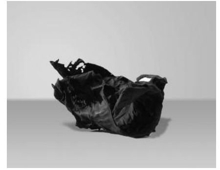
Thunersee Gebilde, Unikate 1-3/2012 Bronzeguss, patiniert Masse: 12 x 18 x 20 cm (1) / 27 x 15 x 12 cm (2) / 15 x 21 x 16 cm (3)

Filip Haag *1961 Bern, lebt und arbeitet in Bern