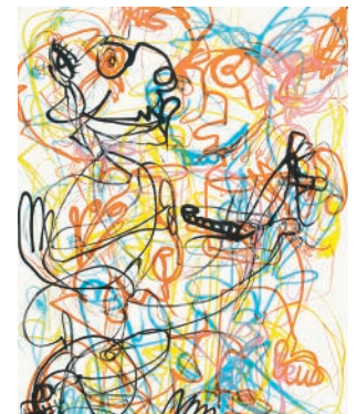
Ohne Titel 1-4/2012 Lithografien, 5-farbig Bild/Blatt: je 50 x 40 cm